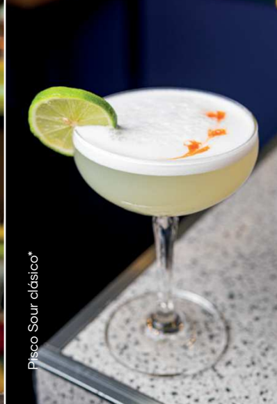
Pisco Sour clásico*