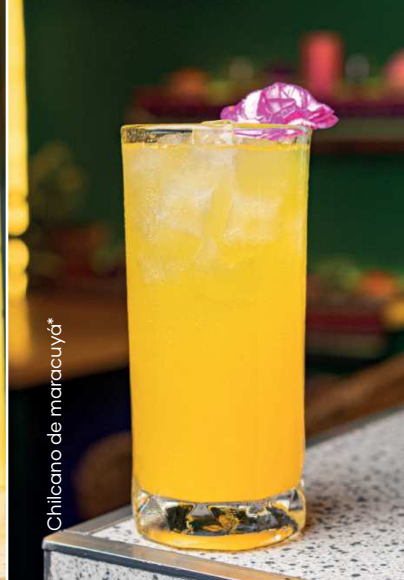
Chilcano de maracuyá*