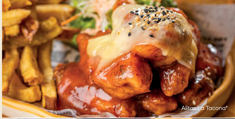
Alitas La Tacona*

6 jugosas y crujientes alitas fritas salteadas y bañadas en salsa chimichurri con porción de papas andinas y ensalada fresca.